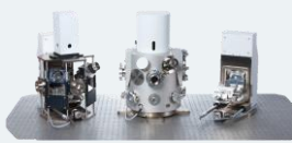
LIBS Interaction Chamber®